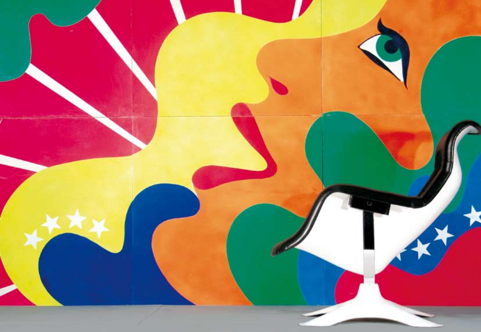
Avartes kända stol Karuselli, designad av Yrjö Kukkapuro år 1964.

unge Kukkapuro uppskattade mycket deras vishet och filosofi. Senare blev Kukkapuro professor och rektor för Konstindustriella Högskolan, där han utvecklade och tog fram sitt funktionalistiska tankesätt i sin undervisning.